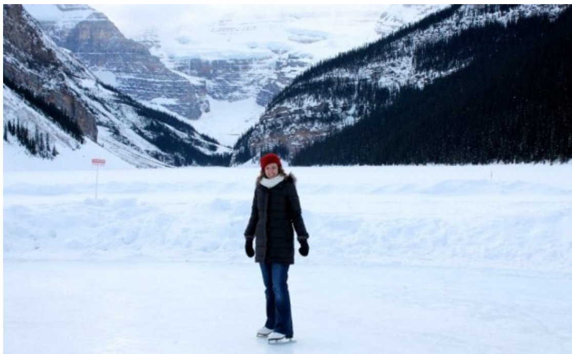
Patinant sobre el llac gelat de Lake Louise, una de les icones de la província d'Alberta.

Justament aquest febrer va venir una amiga meua però vam quedar-nos a Barcelona. El que sí que he portat al Pallars són amics de Barcelona o rodalies i els ha agradat molt l'ambient que hi ha, les muntanyes, les festes majors... A la gent de ciutat els agrada molt veure el contrast.