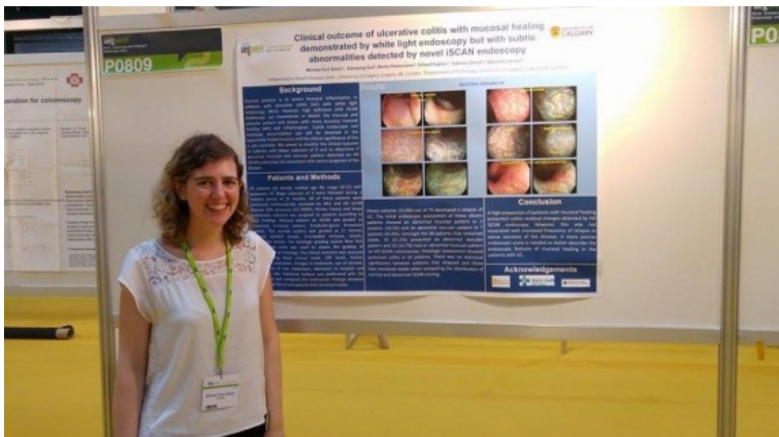
Presentant un dels seus projectes en un congrés europeu de gastroenterologia.