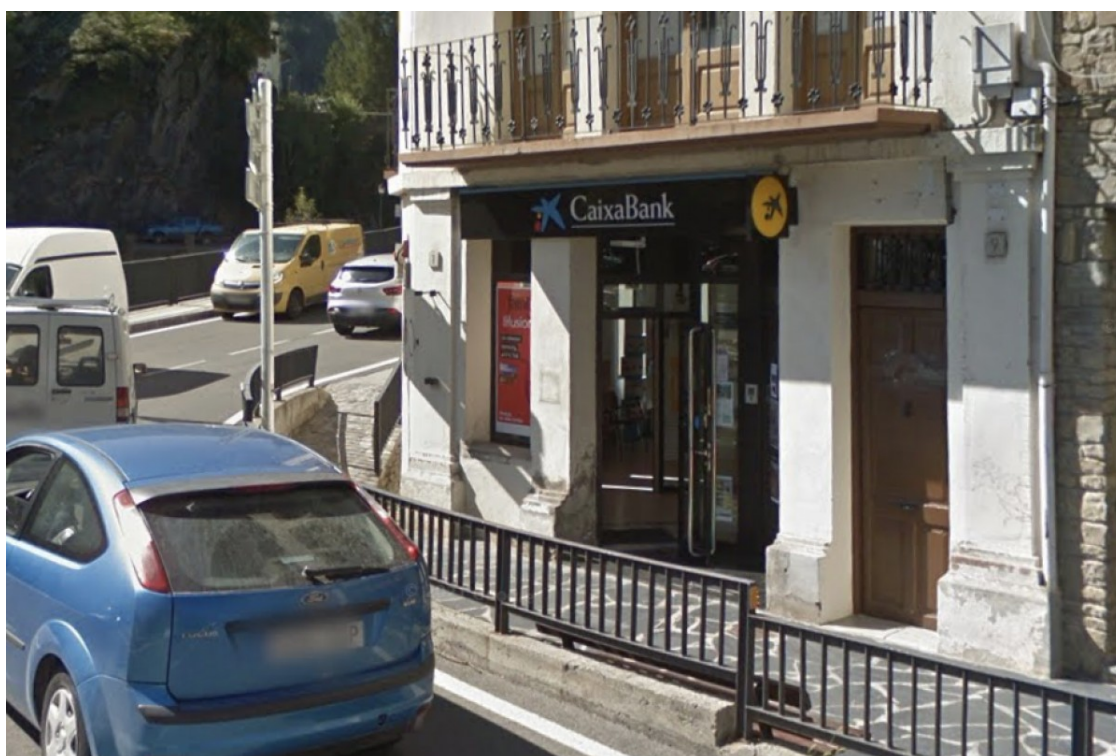
Exterior de l'oficina de CaixaBank de Llavorsí

L'Ajuntament de Llavorsí condemna uns actes que considera que han donat "mala imatge" al municipi i que han perjudicat veïns i visitants