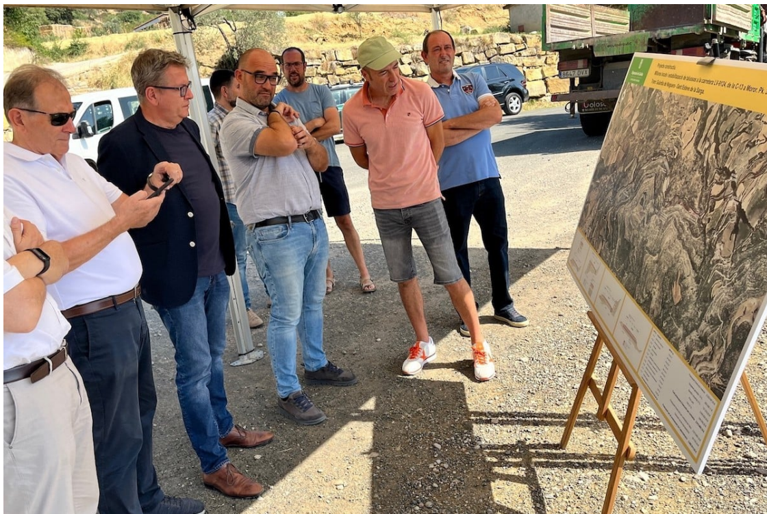
Els diversos representants locals durant la presentació del projecte a Moror

El projecte, que contempla una inversió de 3 milions d'euros i un període d'execució de 18 mesos, s'ha presentat aquest dimarts des de Moror