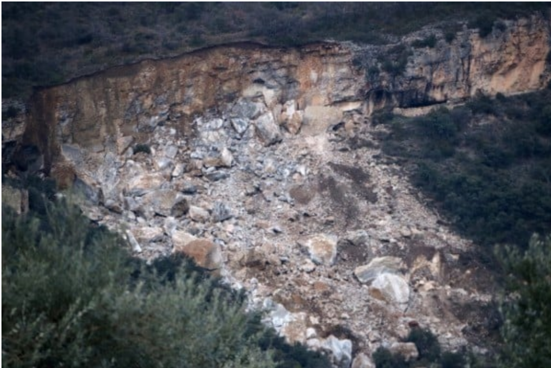
Imatge de la gran esllavissada de l'any 2018 prop de Moror.