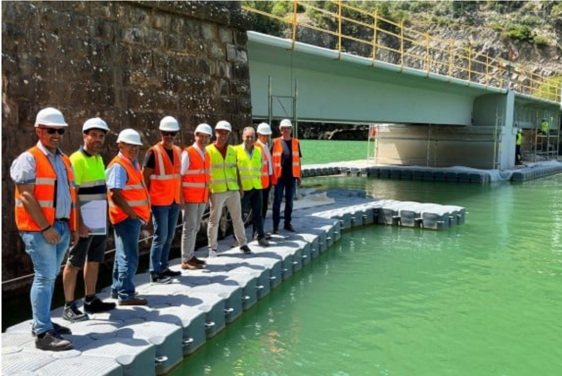
Al pont de Monarés, a Llimiana, s'hi estan realitzant obres de reparació.

Es tracta de la rehabilitació del pont, inclosa l' adequació de la plataforma per habilitar l'ancoratge sobre el tauler amb suficients garanties d'un sistema de contenció, i per generar un espai addicional suficient per al pas de vianants . Una rehabilitació que permetrà també validar l'ús del tauler per a càrregues majors a les de la normativa vigent en el moment del seu projecte, molt més semblants a les normatives d'accions actuals.