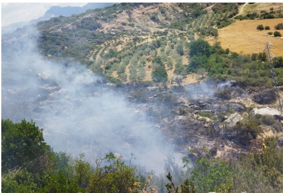
Imatge de l'incendi declarat al Mont de Conques

Al Pallars, aquests nous ajuts seran destinats a la zona del Montsec