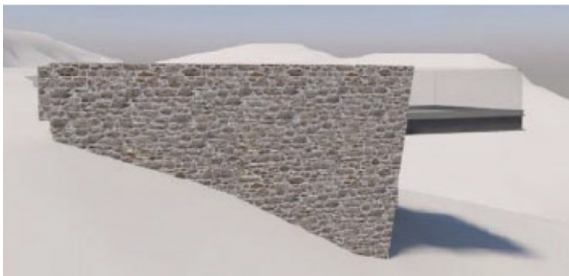
Imatge virtual del nou mirador.

"urbanitzar la muntanya per admirar la muntanya no urbanitzada".