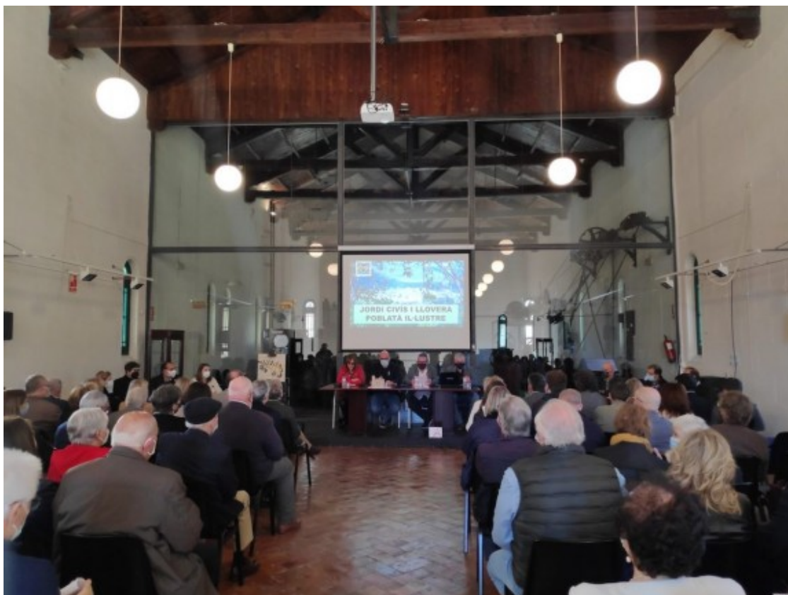
El Molí de l'Oli es va quedar petit durant l'acte de reconeixement