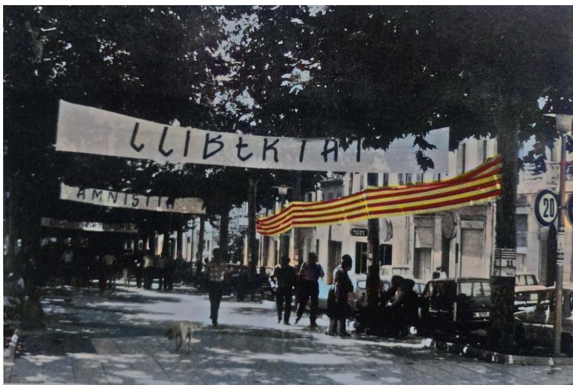
Imatge de la Rambla Dr. Pearson l'11 de setembre de 1977

La lluita contra la dictadura a través dels seus màxims exponents a les comarques pallareses