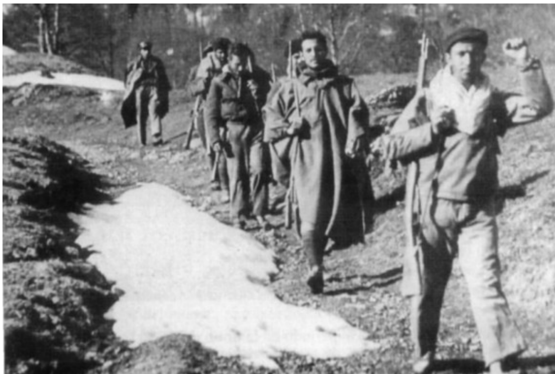
Un grup de maquis al Pirineu.