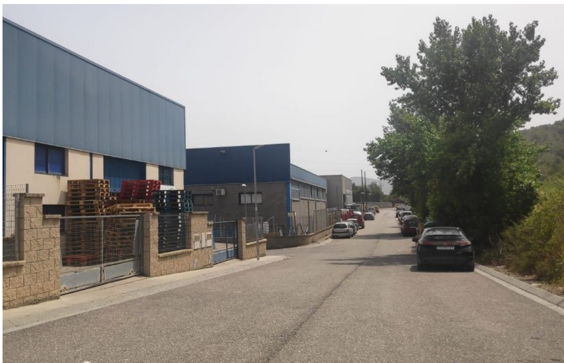
Imatge d'un carrer del polígon industrial de la Pobla

Entre altres aspectes, s'augmentarà el sòl industrial i s'urbanitzaran els carrers que encara no ho estan en un projecte ?vital per a la Pobla?