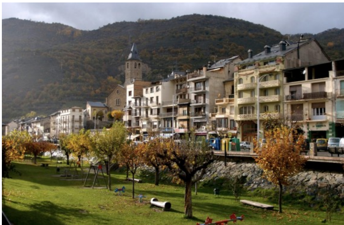
Parc del Riuet, a Sort

El ple de l'Ajuntament de Sort del 18 de març va aprovar el pressupost de l'any 2021. Un ple és una reunió on l'alcalde i els regidors decideixen sobre temes que afecten al poble o municipi.