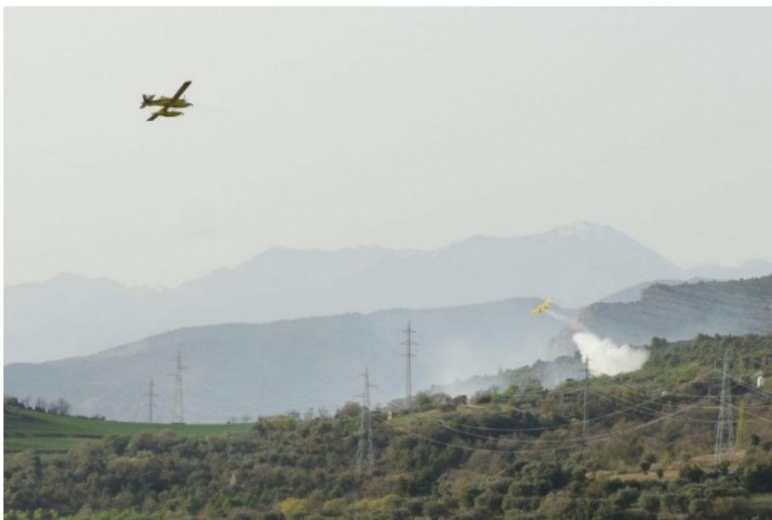
Dos hidroavions treballant a l'incendi.

El foc va cremar 2 hectàrees de vegetació forestal del bosc de Pessonada. Dos hectàrees son com dos camps de futbol del Barça.