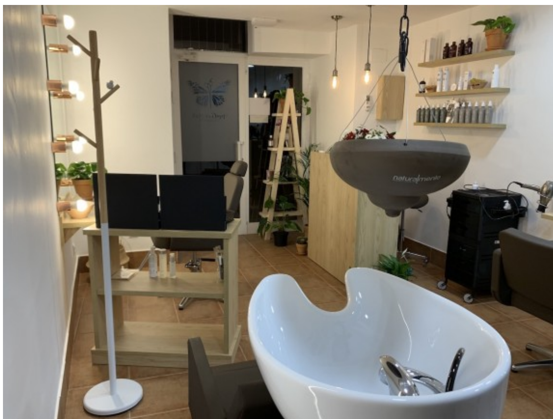
Voliana Perruqueria és el nou servei de perruqueria orgànica hol·lística spa del Pallars.

Entre aquests, podem gaudir del ritual shirodara , consistent en un massatge capil·lar amb olis calents i essències, o el ritual d'hidratació capil·lar benessere . També s'ofereix l'allisat o permanent natural, el tractament anticaiguda capil·lar a base de plantes, tractaments per millorar altres alteracions del cuir cabellut o un servei de maquillatge i cosmètica orgànica. Els nuvis i núvies que ho desitgin també podran escollir un acompanyament des del pentinat i el maquillatge fins als arranjaments durant tota la cerimònia.