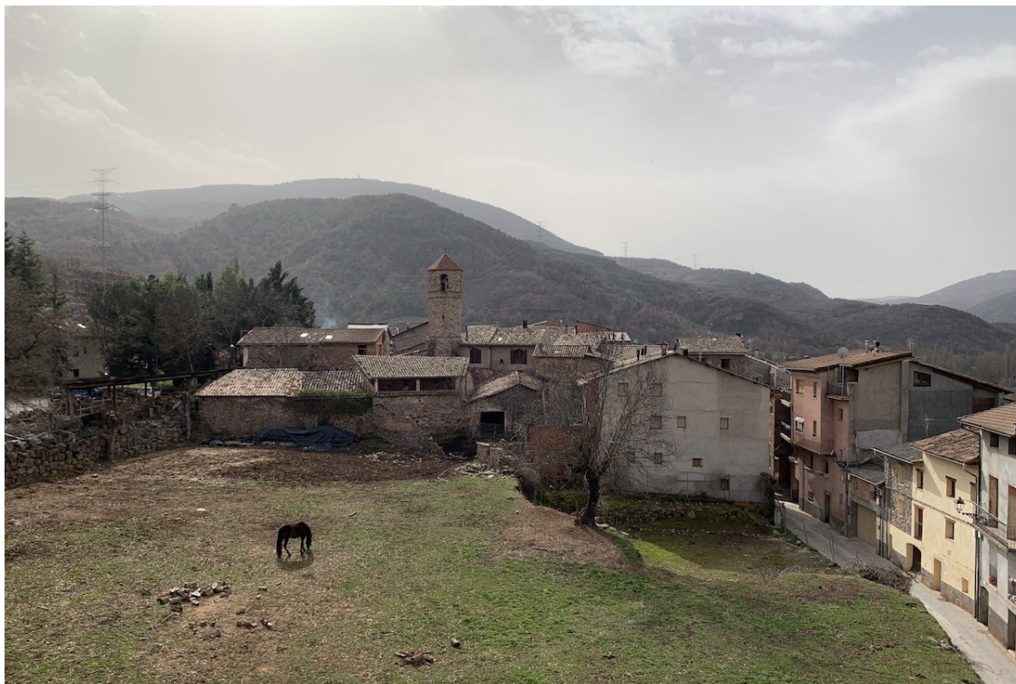
Imatge de la Pobleta de Bellveí, a la Torre de Capdella

La iniciativa vol incentivar la rehabilitació del parc desocupat dels pobles perquè persones i famílies s'hi instal·lin com a primera residència