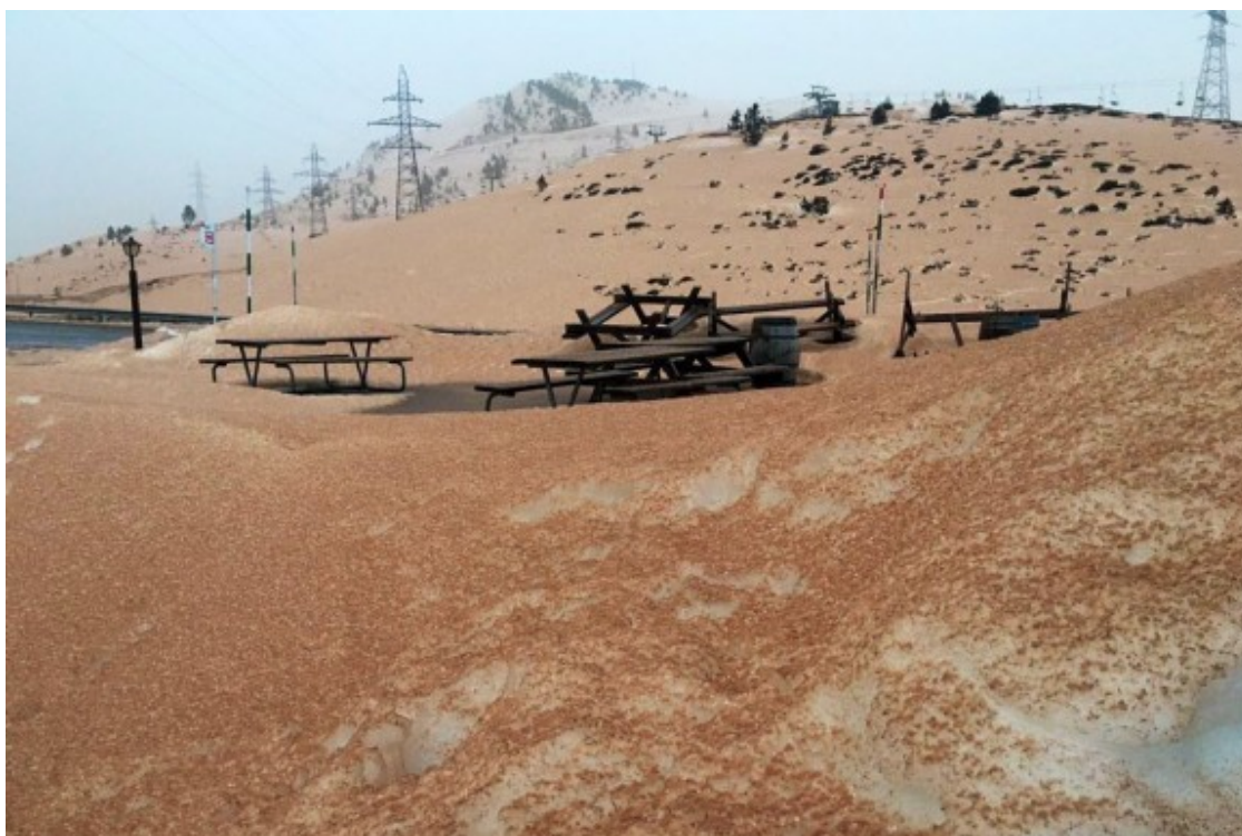
Pols del Sàhara sobre la neu a dalt del Port de la Bonaigua.

El Zaid juga a futbol al Club de Tremp i té ganes de treballar i viure al Pallars.[/despiece] [despiece] La sorra del desert del Sàhara arriba al Pallars? Dia 6 de febrer de 2021