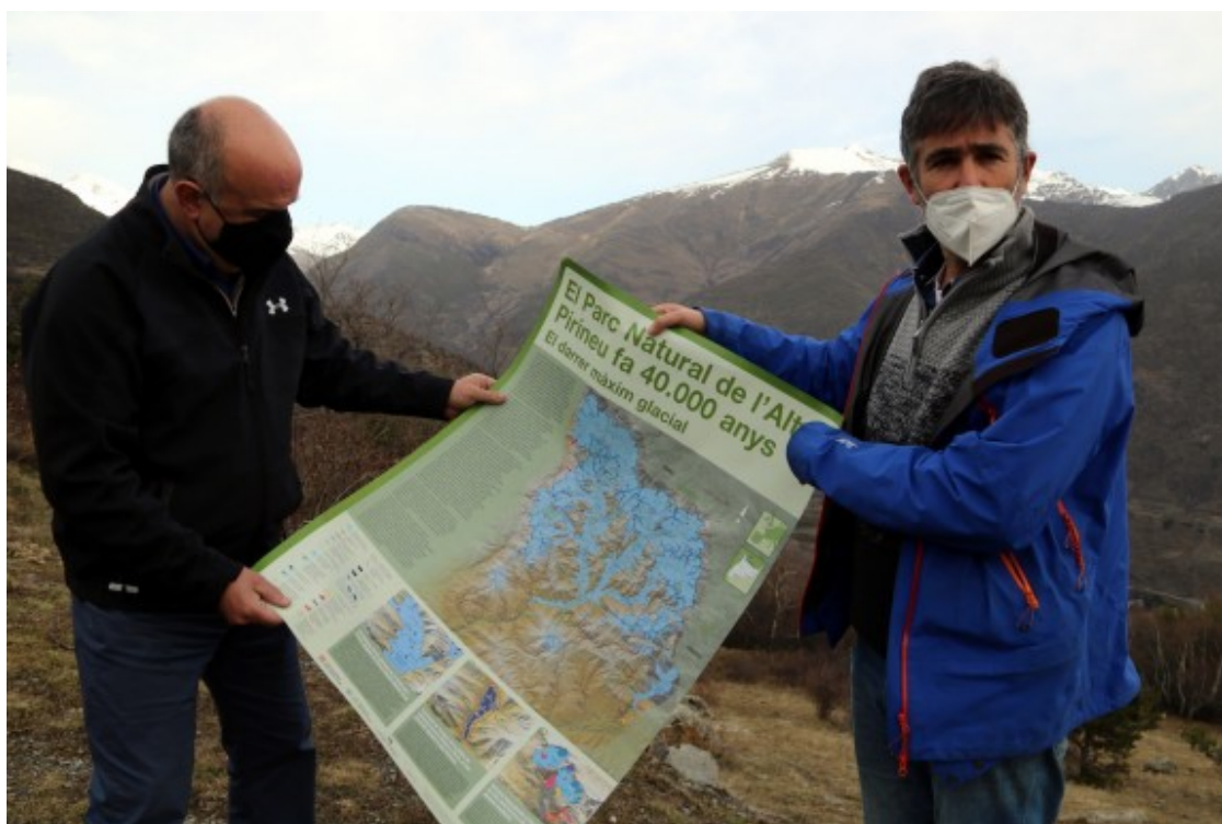
Pòster que ha fet el Parc Natural de l'Alt Pirineu.

Aquest cap de setmana, on més s'ha notat aquest temps ha estat a les pistes d'esquí. La neu blanca ha quedat bruta i plena de sorra del desert. [/despiece] [despiece] El Parc Natural de l'Alt Pirineu ha fet un pòster ?d'una antiga glacera molt gran Dia 8 de febrer de 2021