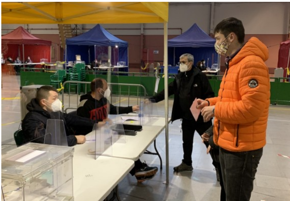
Un veí de Tremp a punt per votar al pavelló del Casal de Tremp.

Els partits polítics Junts per Catalunya (JxC) i Esquerra Republicana de Catalunya (ERC) són els dos més votats a les comarques pallareses.