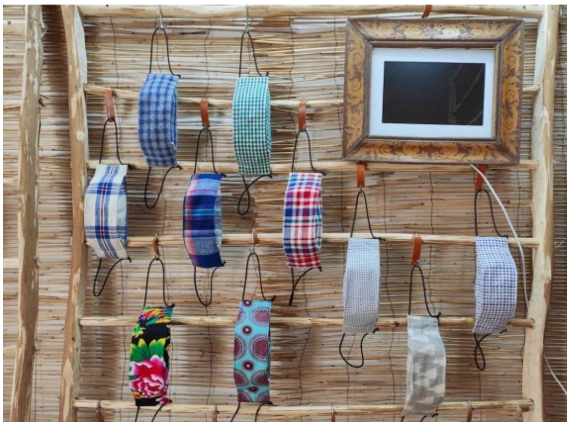
Mostra de les mascaretes que confecciona Ottaia.

Ottaia fabrica peces artesanals amb teles Tubu, que eren teixides als anys 50 al nord de Shanghai per les famílies que vivien al camp. Elles mateixes cultivaven el cotó, el filaven, el tintaven amb tints naturals i el teixien en telers manuals. És un teixit molt resistent i amb un tacte peculiar, tot i que es va deixar de fer a principis dels anys 60 perquè els joves d'aquestes comunitats van deixar el camp per anar a les ciutats i la tradició es va perdre.