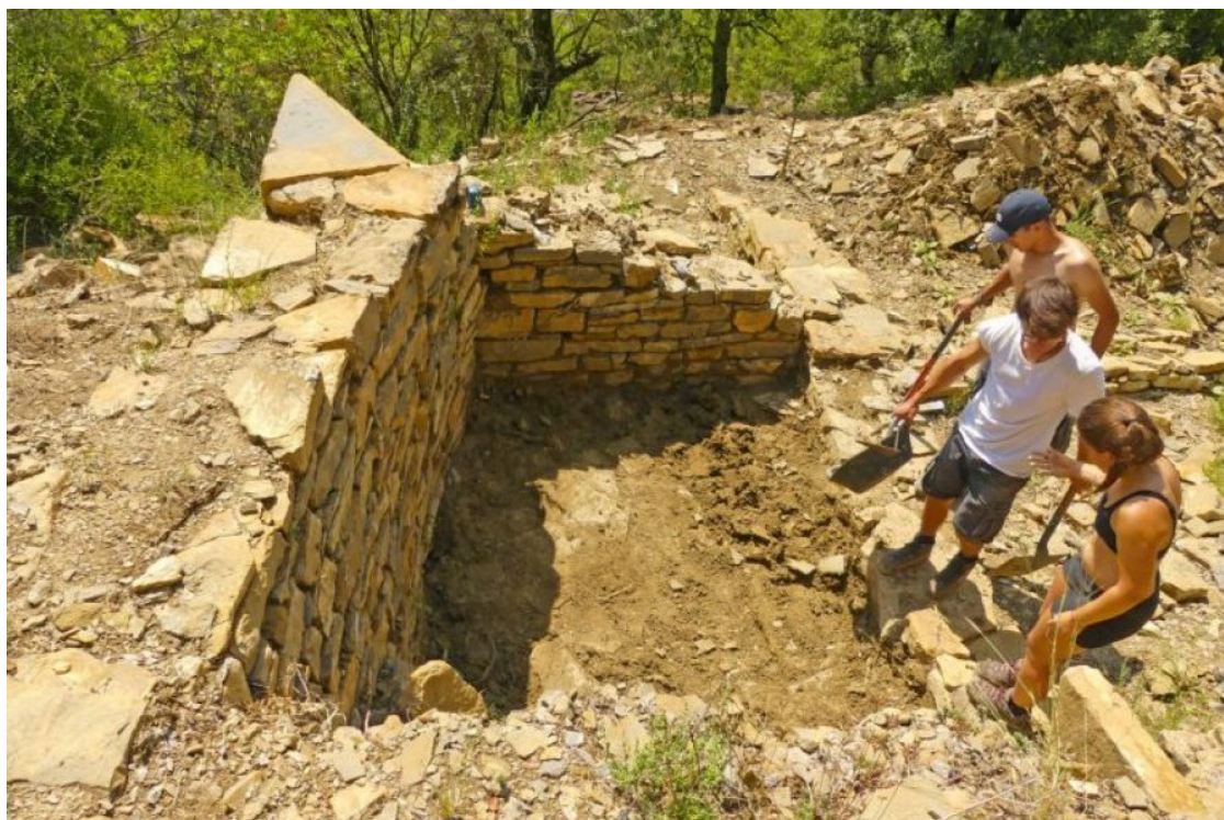
Imatge de les tasques d'excavació al Pui de Segur durant la campanya de l'any passat

L'objectiu de les intervencions és fer una reconstrucció en 3D dels jaciments i excavar els paviments dels diferents períodes