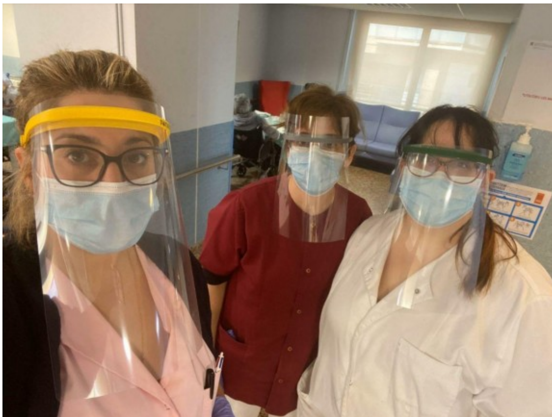
Personal sanitari de l'Alta Ribagorça amb les viseres creades pel grup

La iniciativa, que compta amb el suport d'ajuntaments i consells comarcals per a la compra i distribució del material, de moment està tenint força èxit. Tant és així que el dia 9 d'abril ja s'havien entregat fins a 800 viseres, malgrat que es tardi entre una i dues hores en fabricar-ne només una.